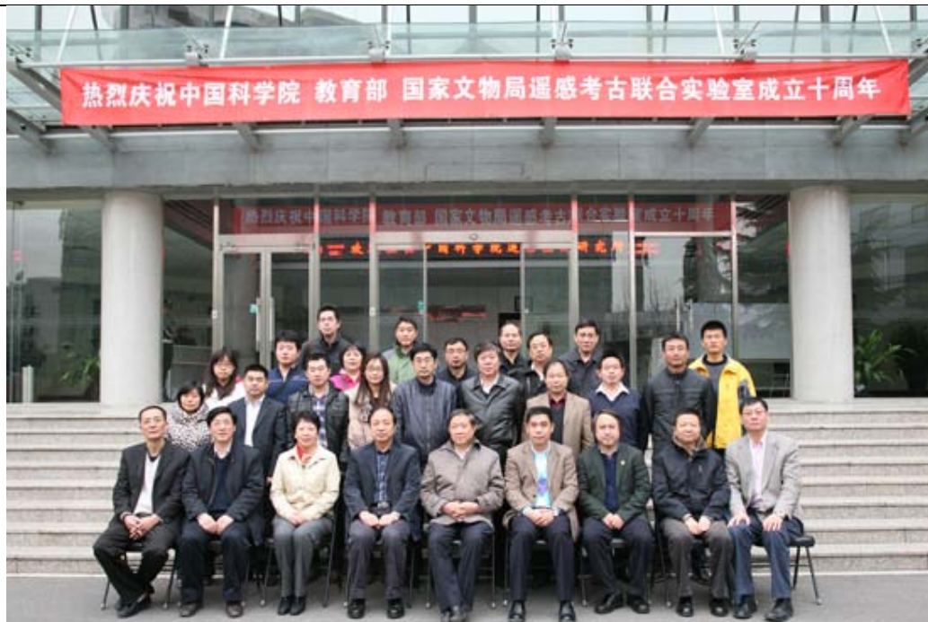
---遥感考古联合实验室供稿