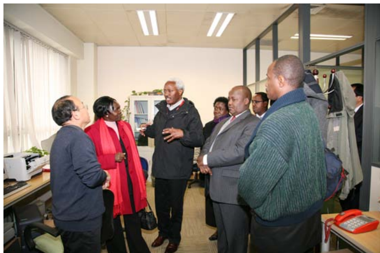
参观农业与生态遥感研究室

乔莫肯尼亚塔农业与技术大学成立于 1981 年，是非洲百强大学之一，主要从事农业、工程、技术、企业发展、环境建设、卫生及其他应用技术的培训和研究。学校设有建筑学院、人力资源学院、电子信息学院、材料工程学院、人文学院、法律学院，涉及农业、计算机、能源环境、传染病和医药、应用生物学等多个研究领域。