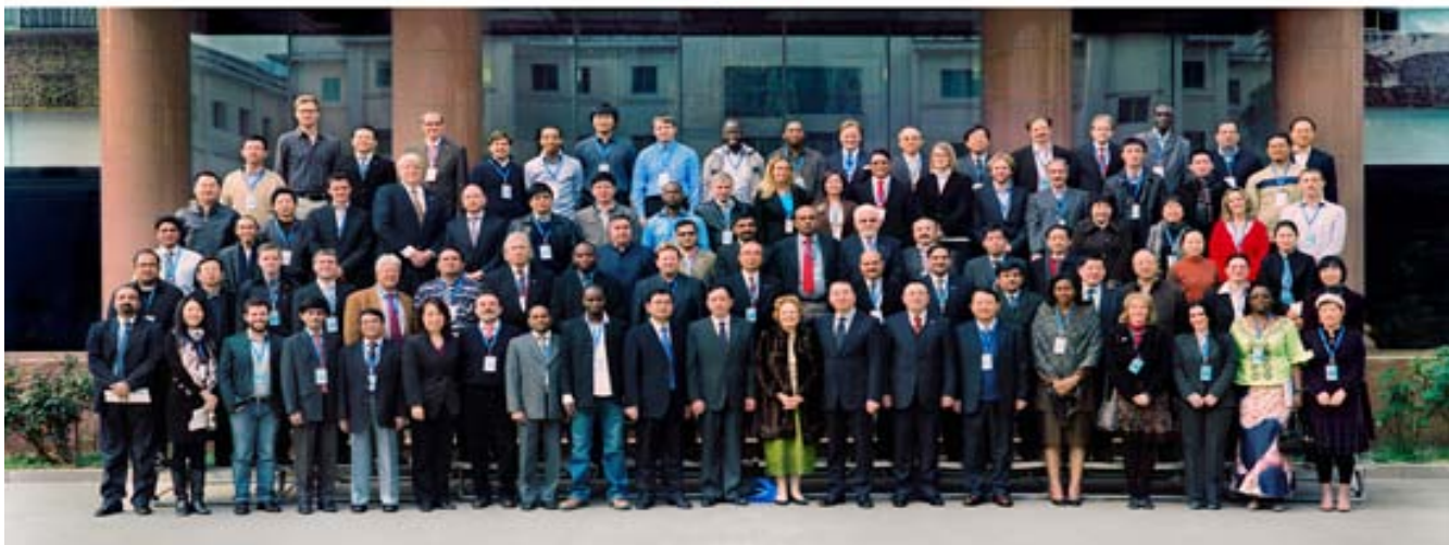
---中科院遥感所科技处供稿

United Nations International Conference on Space-based Technologies for Disaster Risk Management "Best Practices for Risk Reduction and Rapid Response Mapping" 22-25 November 2011 Beijing, China