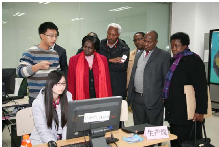
参观国家航天局航天遥感论证中心