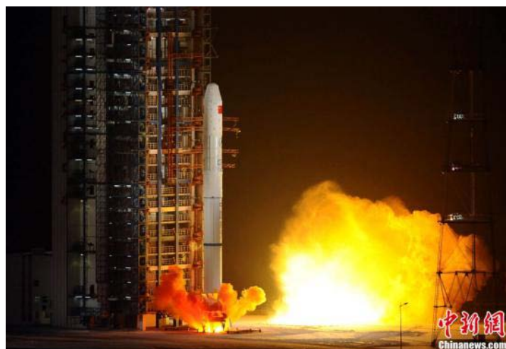
——摘自中国新闻网(2011年11月30日 03:36)

承担此次卫星发射任务的“长征二号丙”运载火箭由中国航天科技集团公司所属中国运载火箭技术研究院研制，这是中国“长征”系列运载火箭第152次航天飞行。(完)