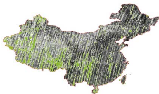
国产高精度对地观测卫星影像图库

国产高精度对地观测卫星影像图库作为第一个基于国产遥感卫星影像高精度图库,将会在国土资源调查、测绘、农业、林业等国家基础地理资源调查中发挥巨大作用,并以中国资源卫星应用中心作为统一数据处理和分发中心,充分发挥国产遥感卫星数据的优势,逐步完善和丰富各类遥感地理信息系统,为我国的对地观测卫星数据应用事业做出贡献。