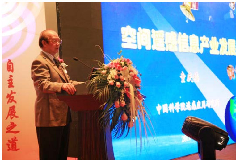
童庆禧院士做大会报告

本次大会是由北京国遥新天地信息技术有限公司主办，大会发布了具备“高效平台、专业引擎、企业级应用”特质的新一代大型三维空间信息平台软件 EV-Globe V3.1 软件，重点介绍了 EV-Globe 在军事、电力、石油石化、海洋，以及资源环境等领域的应用推广情况。同时，北京国遥新天地信息技术有限公司与北京洛斯达科技发展有限公司签署了战略合作协议，与美国东方瞭望全球空间数据公司（East View Cartographic Inc.）共同举办了全球空间数据服务发布会。