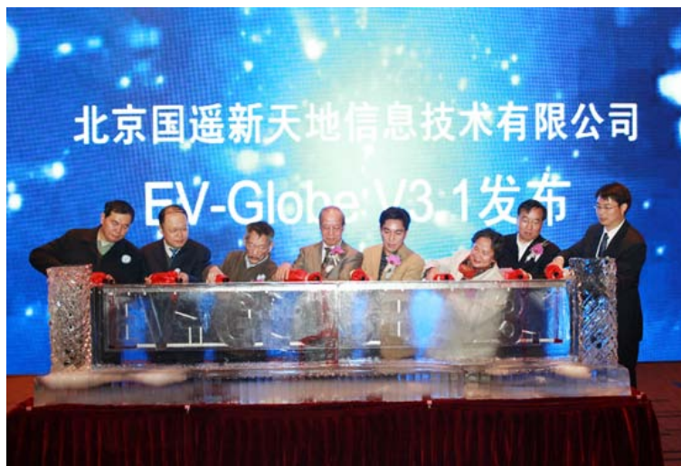
童庆禧、李小文院士出席 EV-Globe 发布仪式