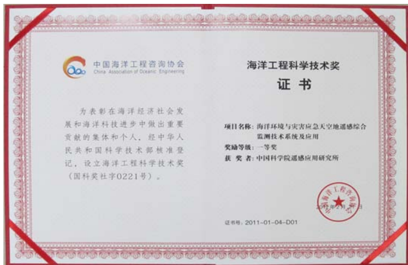
——中科院遥感所供稿

“海洋环境与灾害应急天空地遥感综合监测技术系统及应用”成果是由中科院遥感所牵头，联合国家海洋环境监测中心、国家海洋局北海分局和中科院南海海洋研究所共同完成的科研项目。该项目立足于当前我国海洋环境保护及资源利用现状，基于遥感和地理信息系统技术理论，综合利用卫星、航空、地面监测的多源遥感数据，构建从数据获取、处理、分析到应用服务的天空地海洋遥感应用业务化运行体系，并建立了针对浒苔应急监测、溢油应急监测、渤海湾环境监测、油气勘探、岛礁识别的应用技术示范平台。目前，此系统已成功应用于浒苔监测、溢油监测、渤海环境监测、海洋油气探测、岛礁及岸线遥感识别等方面，取得了良好的经济效益和社会效益。