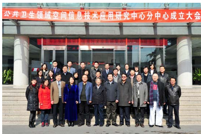
——公共卫生领域空间信息技术应用研究中心供稿

会上，李小文重温了陈述彭院士最早提出应推进交叉学科发展、扩展遥感科学应用领域的构想；回顾了遥感所与军事医学科学院微生物流行病学研究所、北京师范大学遥感与 GIS 研究中心在 2003 年联合成立“公共卫生领域空间信息技术应用研究中心”的过程；同时也充分肯定了中心成立 9 年来在推进空间信息技术在公共卫生领域的研究与应用、促进学术交流和项目合作、探索解决公共卫生领域问题的新思路、新方法等方面做出的突出贡献，尤其是中心提出的“环境健康遥感诊断”全新学科方向进一步推动了遥感科学在环境健康领域的研究和应用。李小文希望大家继续努力，共同推进遥感技术与应用交叉学科的发展，推动遥感技术更快更有效地应用于公共卫生事业，为环境健康与人类可持续发展做出新的更大的贡献。